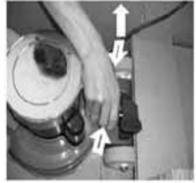
Schritt 3 - Drücken Sie Abdeckung des Gelenkkasten nach innen und ziehen Sie diese heraus.