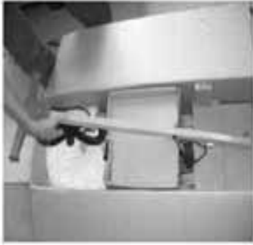
Schritt 1 - Öffnen Sie den Karton.