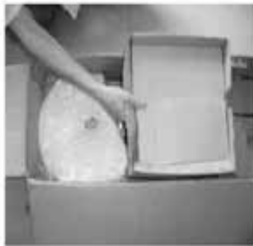
Schritt 2 - Entnehmen Sie die innere Verpackung.