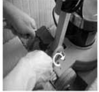
Schritt 6 - Montieren Sie die Befestigungsmutter bis der Bediengriff spielfrei und leicht drehbar sitzt.