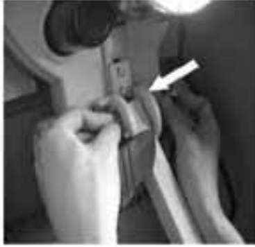
Schritt 5 - Positionieren Sie den Bediengriff und montieren Sie die Befestigungsschraube.