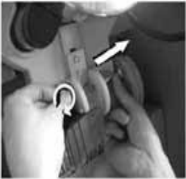
Schritt 4 - Entnehmen Sie die Schraube der Deichselbefestigung.