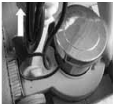
Schritt 8 - Nehmen Sie die Maschine aus dem Karton.