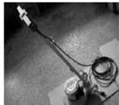
Schritt 9 - Nun kann der Padhalter oder eine Bürste montiert werden.