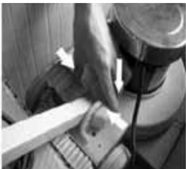
Schritt 7 - Drücken Sie die Abdeckung des Gelenkkastens wieder in die Arretierungen.